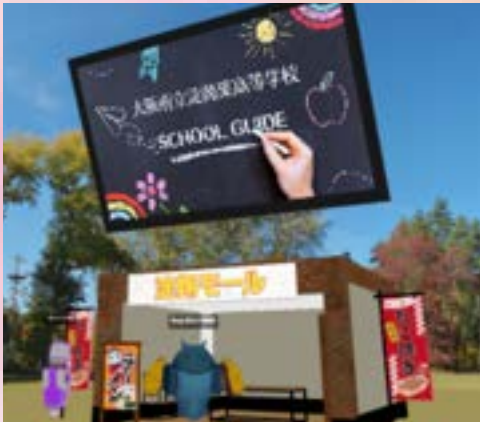
淀翔モール オープン