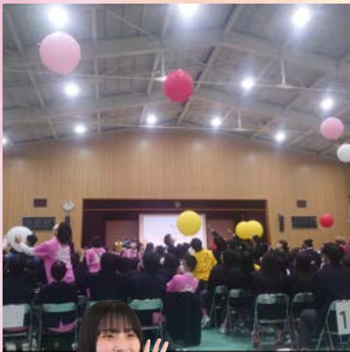
10月 淀フェス (文化祭の部)