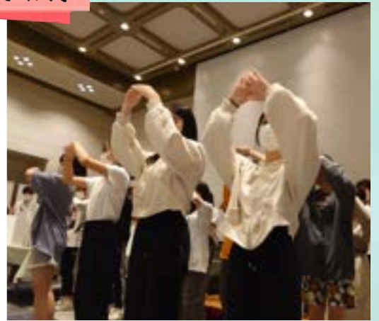
11月 淀フェス (体育祭の部)