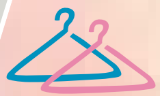
スカート スラックスが べる