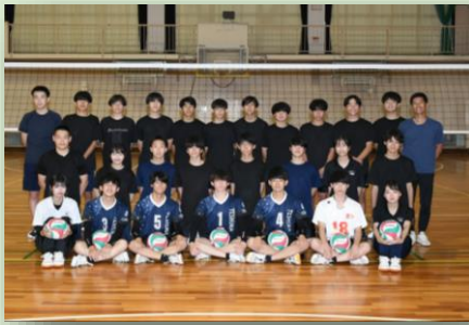
男子バレーボール部