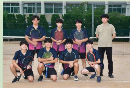
男子硬式テニス部

部活動で充実した 高校生活を！ 皆さんの入部を 待っています。 詳しくは、 クラブブログを！