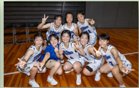
女子バスケットボール部