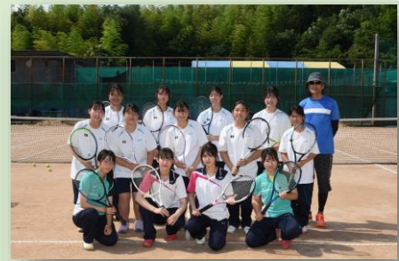
女子硬式テニス部

部活動で充実した 高校生活を！ 皆さんの入部を 待っています。 詳しくは、 クラブブログを！